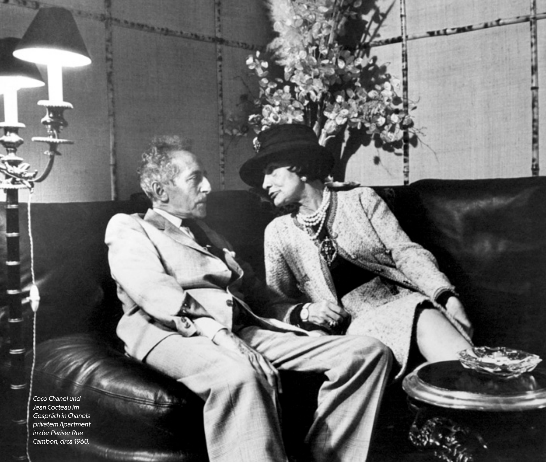
Coco Chanel und Jean Cocteau im Gespräch in Chanel's privatem Apartment in der Pariser Rue Cambon, circa 1960.